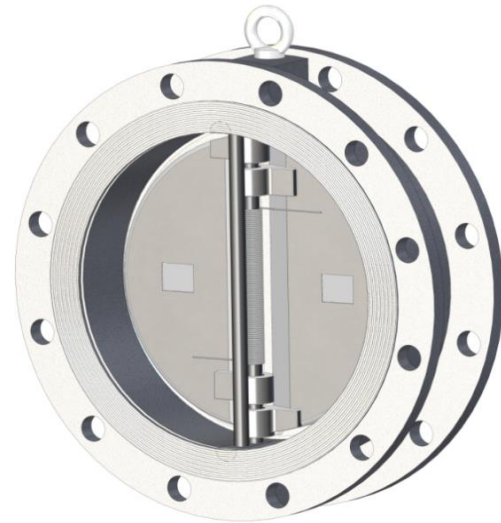
Gehäuseform Doppelflansch Flange type body