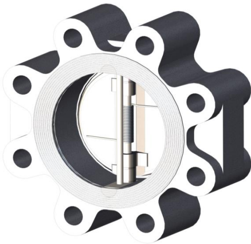
Gehäuseform Lug Type Lug type body

Pressure-Temperature tables apply to metal seated design. For soft seated designs, observe the temperature limits of the seal materials, see temperature table on page 1.