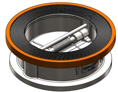
Flansch-Zentrierung Flange centering ring